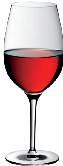
ROTWEINKELCH 01 RED WINE GOBLET 01

Inhalt / Capacity 650 ml Höhe / Height 227 mm Ø 95 mm VPE / PU 6 Stk./pcs. Art-Nr. / No: 58.0020.0035 58.0020.0235 (0,2 l)