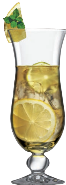
COCKTAIL 96 (Serie MANHATTAN)

Inhalt / Capacity 240 ml Höhe / Height 172 mm Ø 116 mm VPE / PU 6 Stk./pcs. Art-Nr. / No: 58.0010.0025