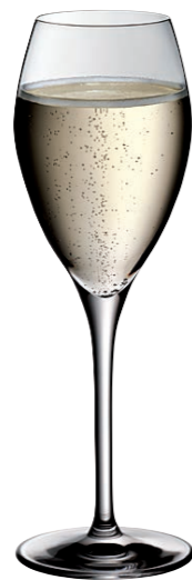
CHAMPAGNER 29 CHAMPAGNE 29

Inhalt / Capacity 387 ml Höhe / Height 175 mm Ø 79 mm VPE / PU 6 Stk./pcs. Art-Nr. / No: 58.0020.0010 58.0020.0210 (0,2 l)