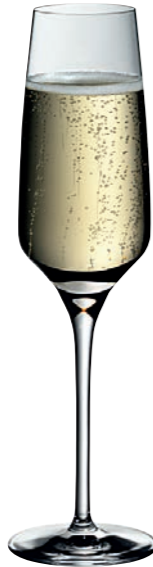
SEKTKELCH 07 FLUTE CHAMPAGNE 07

Inhalt / Capacity 265 ml Höhe / Height 223 mm Ø 70 mm VPE / PU 6 Stk./pcs. Art-Nr. / No. 58.0050.0029 58.0050.0129 (0,1 l)