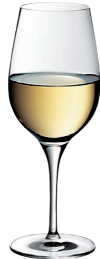
WEISSWEINKELCH 02 WHITE WINE GOBLET 02

Inhalt / Capacity 500 ml Höhe / Height 219 mm Ø 87 mm VPE / PU 6 Stk./pcs. Art-Nr. / No: 58.0020.0001 58.0020.0201 (0,2 l)