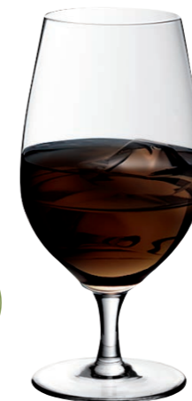
MINIBAR 10 (Serie SMART)

Inhalt / Capacity 387 ml Höhe / Height 175 mm Ø 79 mm VPE / PU 6 Stk./pcs. Art-Nr. / No: 58.0020.0010 58.0020.0210 (0,2 l)