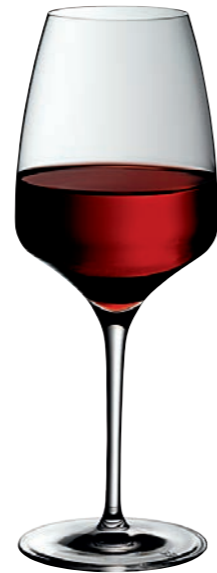
ROTWEINKELCH 01 RED WINE GOBLET 01

Inhalt / Capacity 645 ml Höhe / Height 238 mm Ø 95 mm VPE / PU 6 Stk./pcs. Art-Nr. / No. 58.0050.0035 58.0050.0235 (0,2 l)