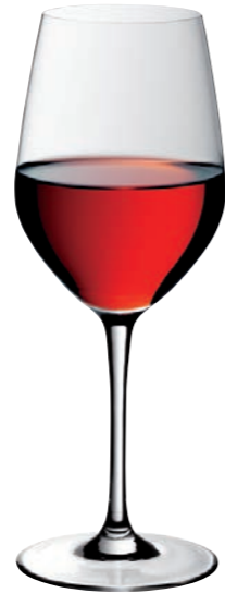
ROTWEINKELCH 01 RED WINE GOBLET 01

Inhalt / Capacity 635 ml Höhe / Height 239 mm Ø 95 mm VPE / PU 6 Stk./pcs. Art-Nr. / No: 58.0010.0035 58.0010.0235 (0,2 l)