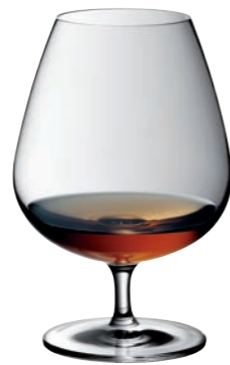
COGNAC 18 BRANDY GLASS 18

Inhalt / Capacity 180 ml Höhe / Height 173 mm Ø 65 mm VPE / PU 6 Stk./pcs. Art-Nr. / No: 58.0010.0004