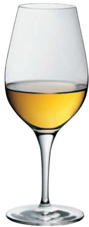
TASTING / DESSERTWEIN 04 TASTING 04

Inhalt / Capacity 250 ml Höhe / Height 216 mm Ø 65 mm VPE / PU 6 Stk./pcs. Art-Nr. / No: 58.0010.0029 58.0010.0129 (0,1 l)