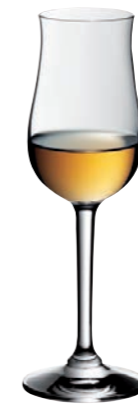
DIGESTIF 23 DIGESTIVE 23

Inhalt / Capacity 95 ml Höhe / Height 173 mm Ø 55 mm VPE / PU 6 Stk./pcs. Art-Nr. / No: 58.0010.0030