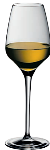
SHERRY / PORTWEIN 04 SHERRY / PORT 04

Inhalt / Capacity 188 ml Höhe / Height 224 mm Ø 63 mm VPE / PU 6 Stk./pcs. Art-Nr. / No. 58.0050.0007 58.0050.0107 (0,1 l)