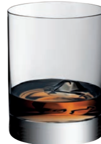
TUMBLER XL 16

Inhalt / Capacity 420 ml Höhe / Height 106 mm Ø 85 mm VPE / PU 6 Stk./pcs. Art-Nr. / No: 58.0030.0016