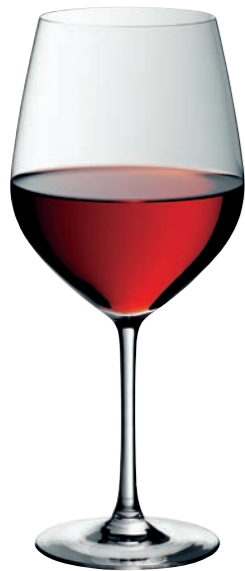
BURGUNDER 99 BURGUNDY 99

Inhalt / Capacity 705 ml Höhe / Height 235 mm Ø 102 mm VPE / PU 6 Stk./pcs. Art-Nr. / No: 58.0010.0099 58.0010.0299 (0,2 l)