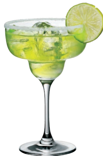
MARGARITA 97 (Serie MANHATTAN)

Inhalt / Capacity 480 ml Höhe / Height 209 mm Ø 80 mm VPE / PU 6 Stk./pcs. Art-Nr. / No: 58.0030.0096