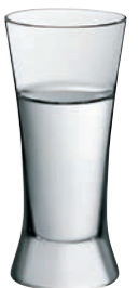
SHORT 21 SHOT 21

Inhalt / Capacity 57 ml Höhe / Height 81 mm Ø 39 mm VPE / PU 6 Stk./pcs. Art-Nr. / No: 58.0030.0020