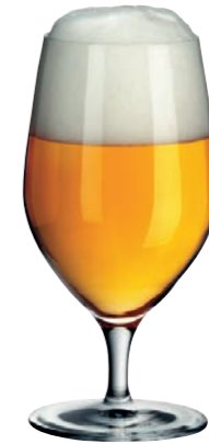
BIERGLAS 11 BEER GLASS 11

Inhalt / Capacity 104 ml Höhe / Height 169 mm Ø 56 mm VPE / PU 6 Stk./pcs. Art-Nr. / No: 58.0010.0023