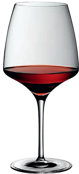
BURGUNDER 99 BURGUNDY 99

Inhalt / Capacity 695 ml Höhe / Height 231 mm Ø 107 mm VPE / PU 6 Stk./pcs. Art-Nr. / No. 58.0050.0099 58.0050.0299 (0,2 l)