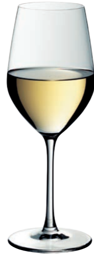
WEISSWEINKELCH 02 WHITE WINE GOBLET 02

Inhalt / Capacity 450 ml Höhe / Height 224 mm Ø 85 mm VPE / PU 6 Stk./pcs. Art-Nr. / No: 58.0010.0001 58.0010.0201 (0,2 l)