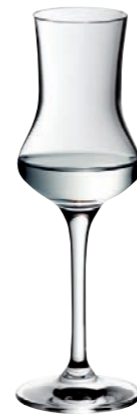
DESTILLAT 30 DESTILLATE 30

Inhalt / Capacity 610 ml Höhe / Height 155 mm Ø 104 mm VPE / PU 6 Stk./pcs. Art-Nr. / No: 58.0010.0018