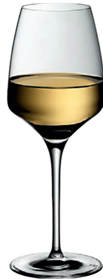
WEISSWEINKELCH 02 WHITE WINE GOBLET 02

Inhalt / Capacity 450 ml Höhe / Height 225 mm Ø 84 mm VPE / PU 6 Stk./pcs. Art-Nr. / No. 58.0050.0001 58.0050.0201 (0,2 l)