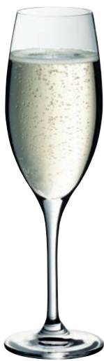
CHAMPAGNER 29 CHAMPAGNE 29

Inhalt / Capacity 250 ml Höhe / Height 216 mm Ø 65 mm VPE / PU 6 Stk./pcs. Art-Nr. / No: 58.0010.0029 58.0010.0129 (0,1 l)