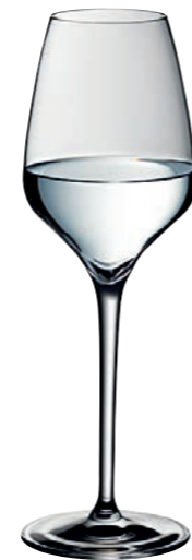
DIGESTIF 04 DIGESTIVE 04

Inhalt / Capacity 190 ml Höhe / Height 200 mm Ø 66 mm VPE / PU 6 Stk./pcs. Art-Nr. / No. 58.0050.0004