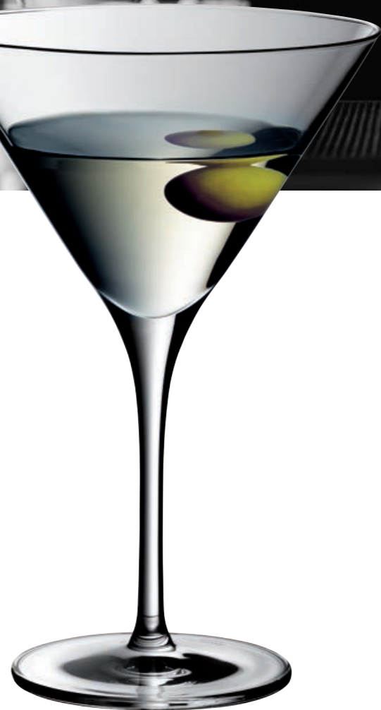
MARTINI 25 (Serie ROYAL)

ungeeicht / uncalibrated geeicht / calibrated Sondereichungen auf Anfrage Line customisation upon request