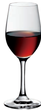
SHERRY / PORTWEIN 04 SHERRY / PORT 04

Inhalt / Capacity 290 ml Höhe / Height 185 mm Ø 73 mm VPE / PU 6 Stk./pcs. Art-Nr. / No: 58.0020.0004