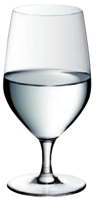
WASSERGLAS 11 MINERAL WATER 11

Inhalt / Capacity 410 ml Höhe / Height 161 mm Ø 81 mm VPE / PU 6 Stk./pcs. Art-Nr. / No: 58.0010.0011 58.0010.0411 (0,3 l)