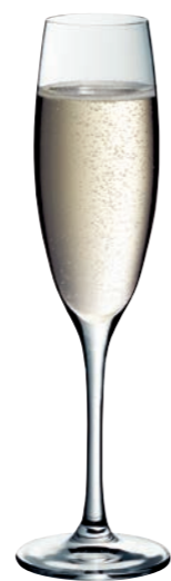
SEKTKELCH 07 FLUTE CHAMPAGNE 07

Inhalt / Capacity 210 ml Höhe / Height 205 mm Ø 68 mm VPE / PU 6 Stk./pcs. Art-Nr. / No: 58.0020.0029 58.0020.0129 (0,1 l)