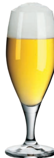
BIERTULPE 11 TULIP BEER GLASS 11

Inhalt / Capacity 340 ml Höhe / Height 172 mm Ø 111 mm VPE / PU 6 Stk./pcs. Art-Nr. / No: 58.0030.0097